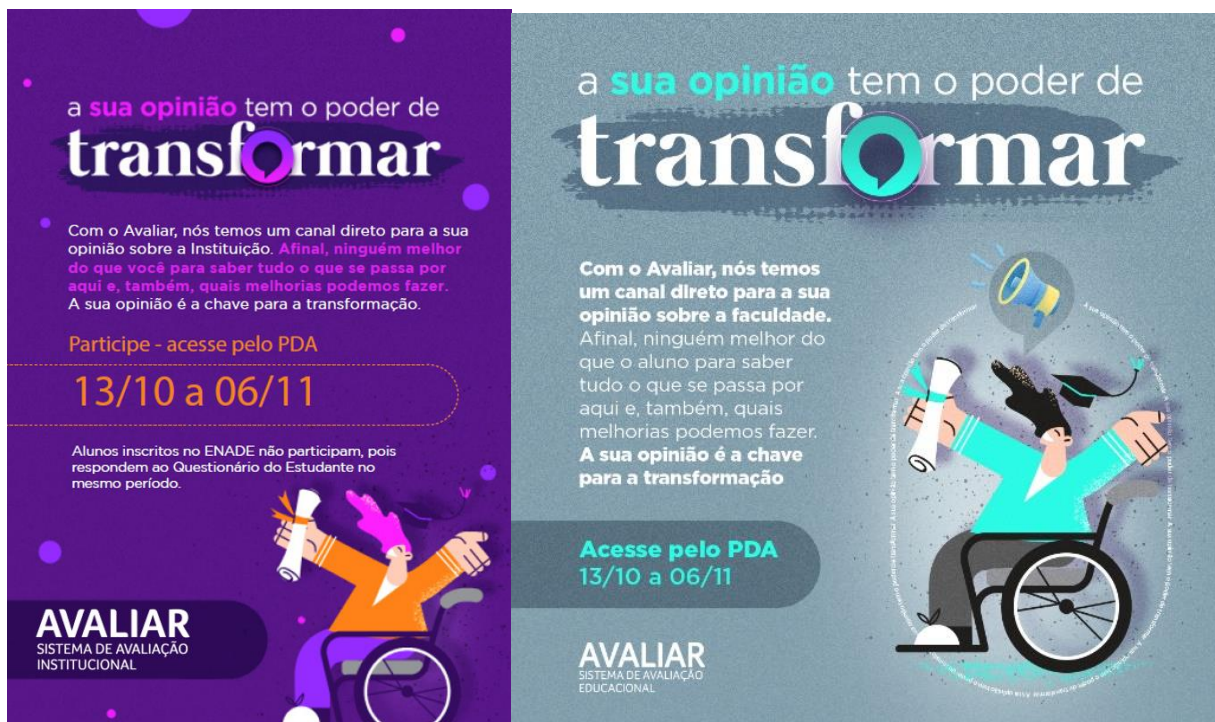
Peças de sensibilização do Avaliar 2022

A participação e o engajamento da comunidade acadêmica no Avaliar são importantes para que tenhamos dados fidedignos à realidade de nossa Instituição. Por isso, antes e durante a aplicação do Avaliar, há ações de sensibilização para apropriação de discentes, docentes, técnico-administrativos e coordenações, que respondem aos questionários correspondentes ao respectivo segmento representativo.