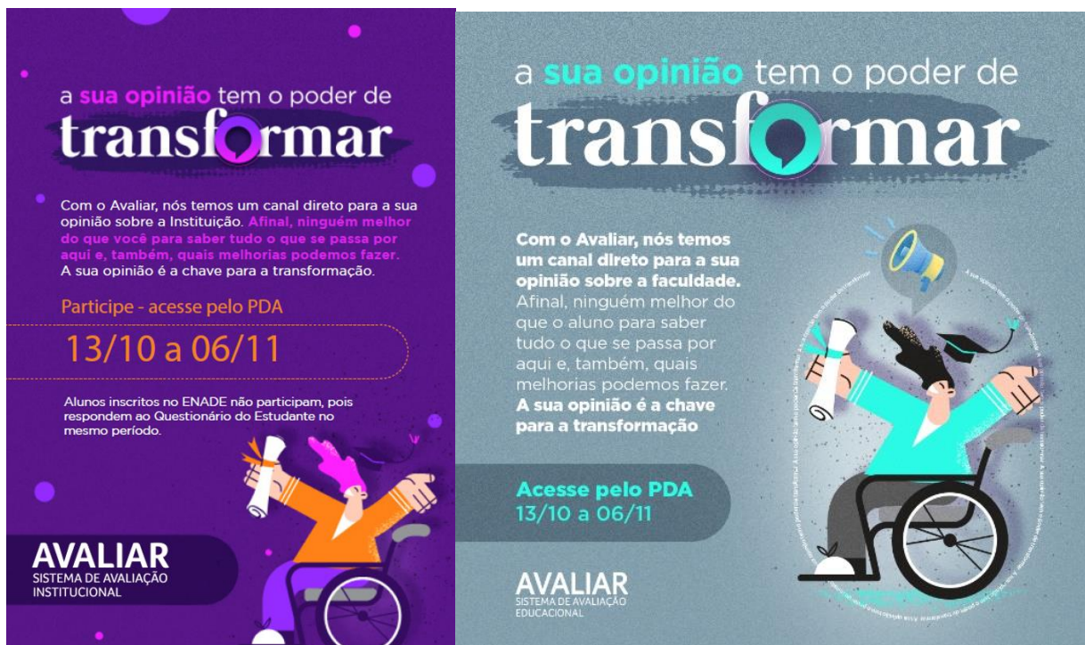
Peças de sensibilização do Avaliar 2022

A participação e o engajamento da comunidade acadêmica no Avaliar são importantes para que tenhamos dados fidedignos à realidade de nossa Instituição. Por isso, antes e durante a aplicação do Avaliar, há ações de sensibilização para apropriação de discentes, docentes, técnico-administrativos e coordenações, que respondem aos questionários correspondentes ao respectivo segmento representativo.