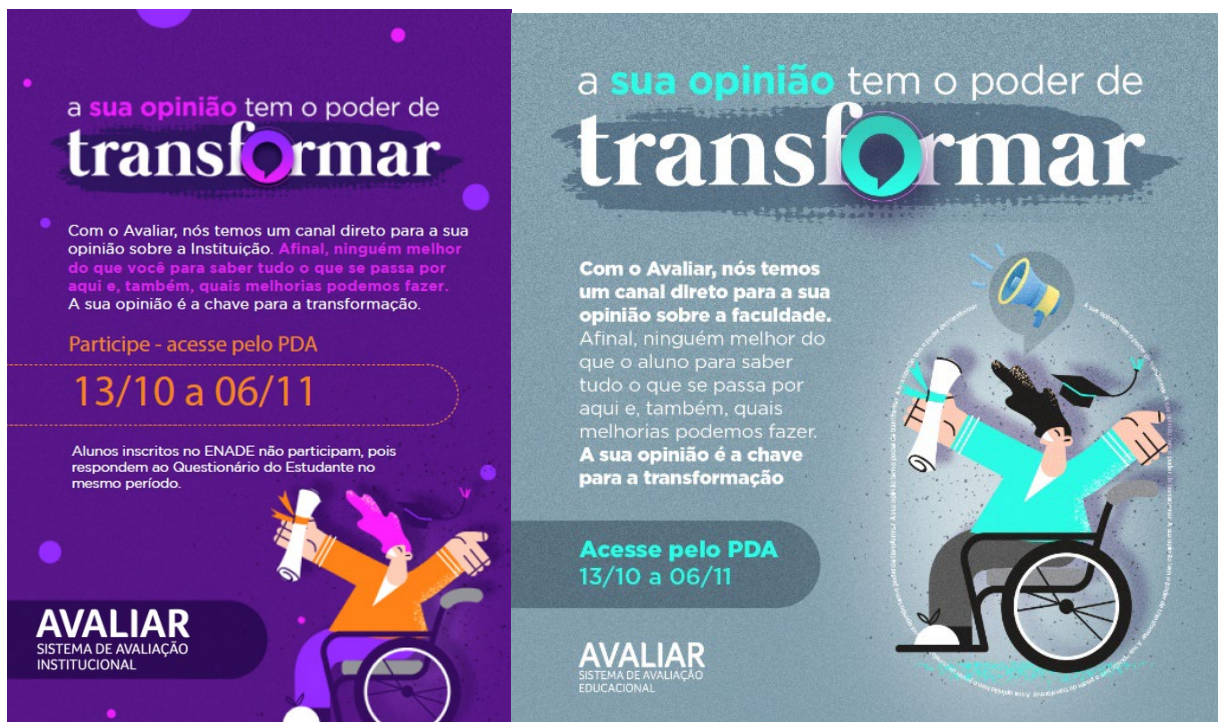
Peças de sensibilização do Avaliar 2022

A participação e o engajamento da comunidade acadêmica no Avaliar são importantes para que tenhamos dados fidedignos à realidade de nossa Instituição. Por isso, antes e durante a aplicação do Avaliar, há ações de sensibilização para apropriação de discentes, docentes, técnico-administrativos e coordenações, que respondem aos questionários correspondentes ao respectivo segmento representativo.